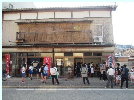
店外にも行列ができる盛況ぶり

当日は天神祭でもあり、子どもや園児を連れた保護者が訪れ、世代を超え昭和レトロな雰囲気を楽しんでいる様子でした。