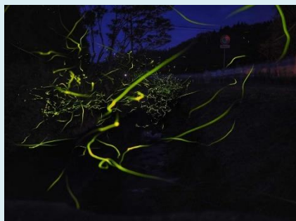
夜8時を過ぎると無数のホタルが乱舞