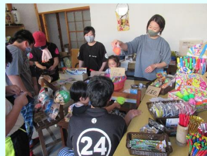
対話を楽しみながら運営